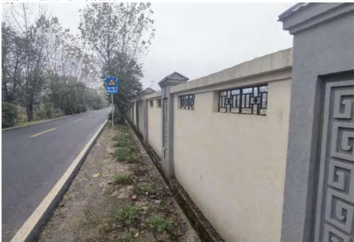
主体工程区排水沟（2022年11月）