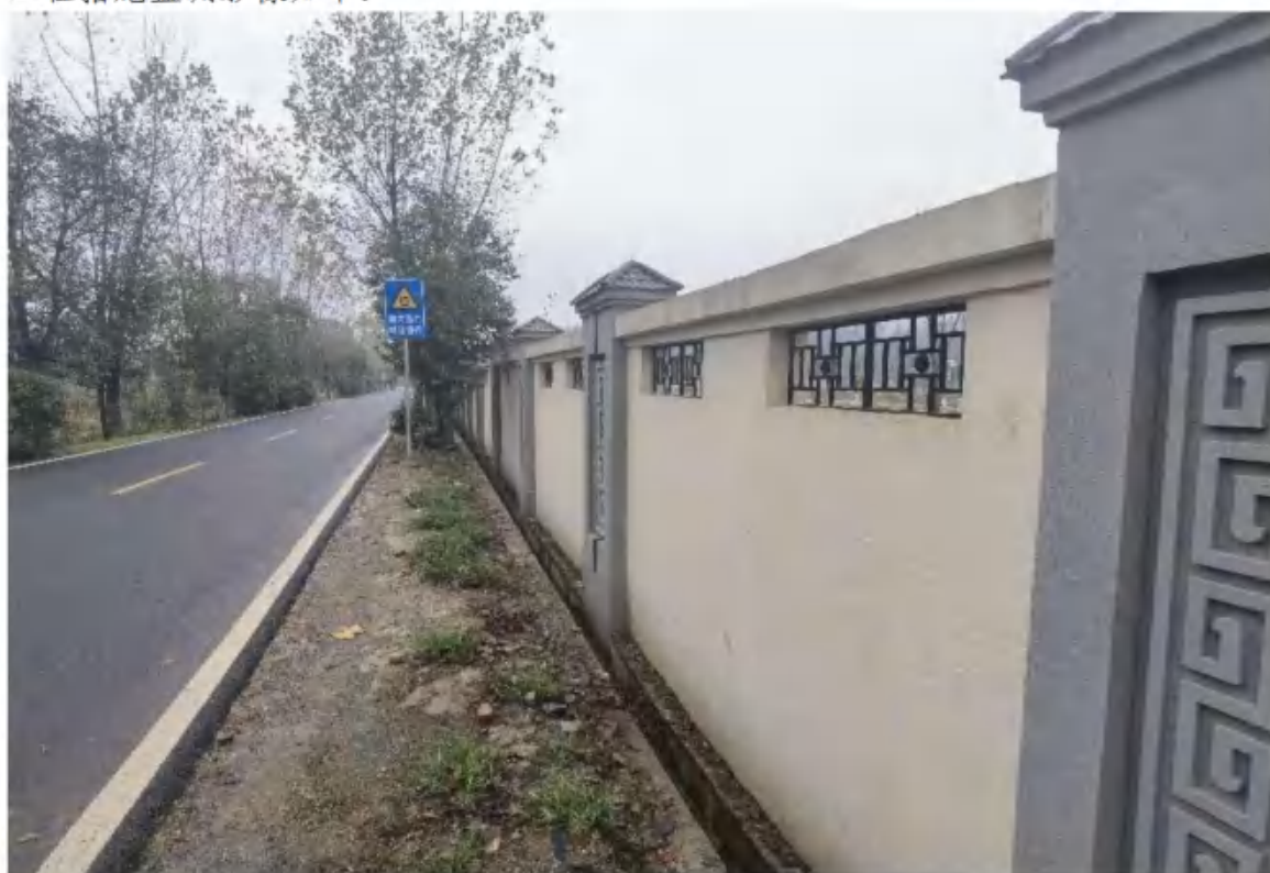
主体工程区排水沟（2022年11月）