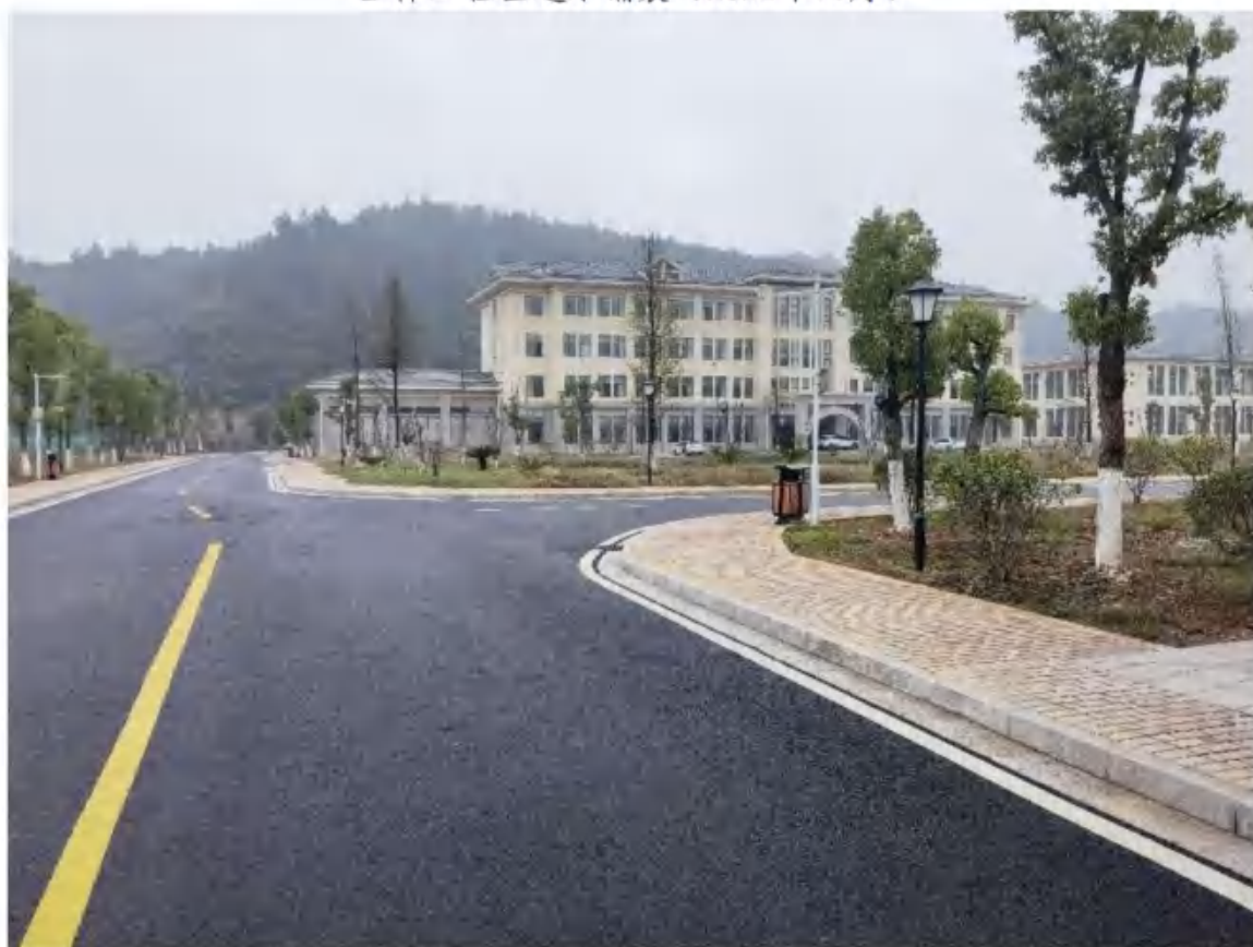
主体工程区雨水口（2022年11月）