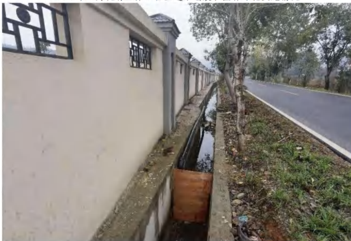
2022年11月现场主体工程区排水沟实施情况