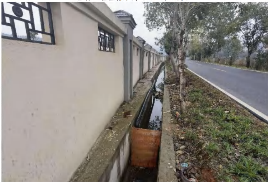
主体工程区排水沟（2022年11月）