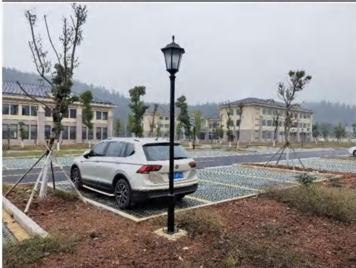
主体工程区透水铺装（2022年11月）