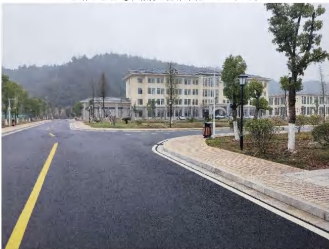
主体工程区雨水口、雨水井（2022年11月）