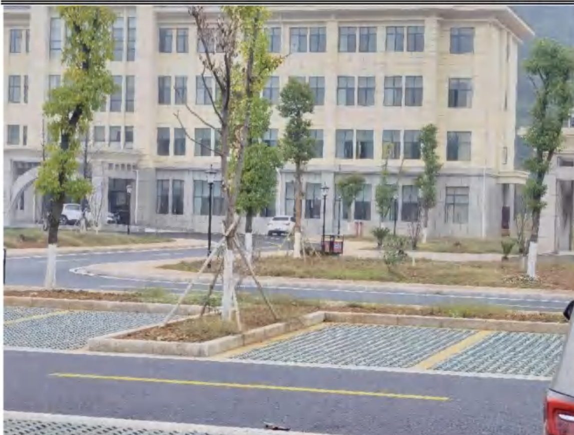
2022年11月现场主体工程区透水铺装和园林绿化实施情况