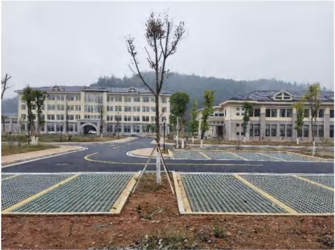
主体工程区透水铺装、园林绿化措施（2022年11月）