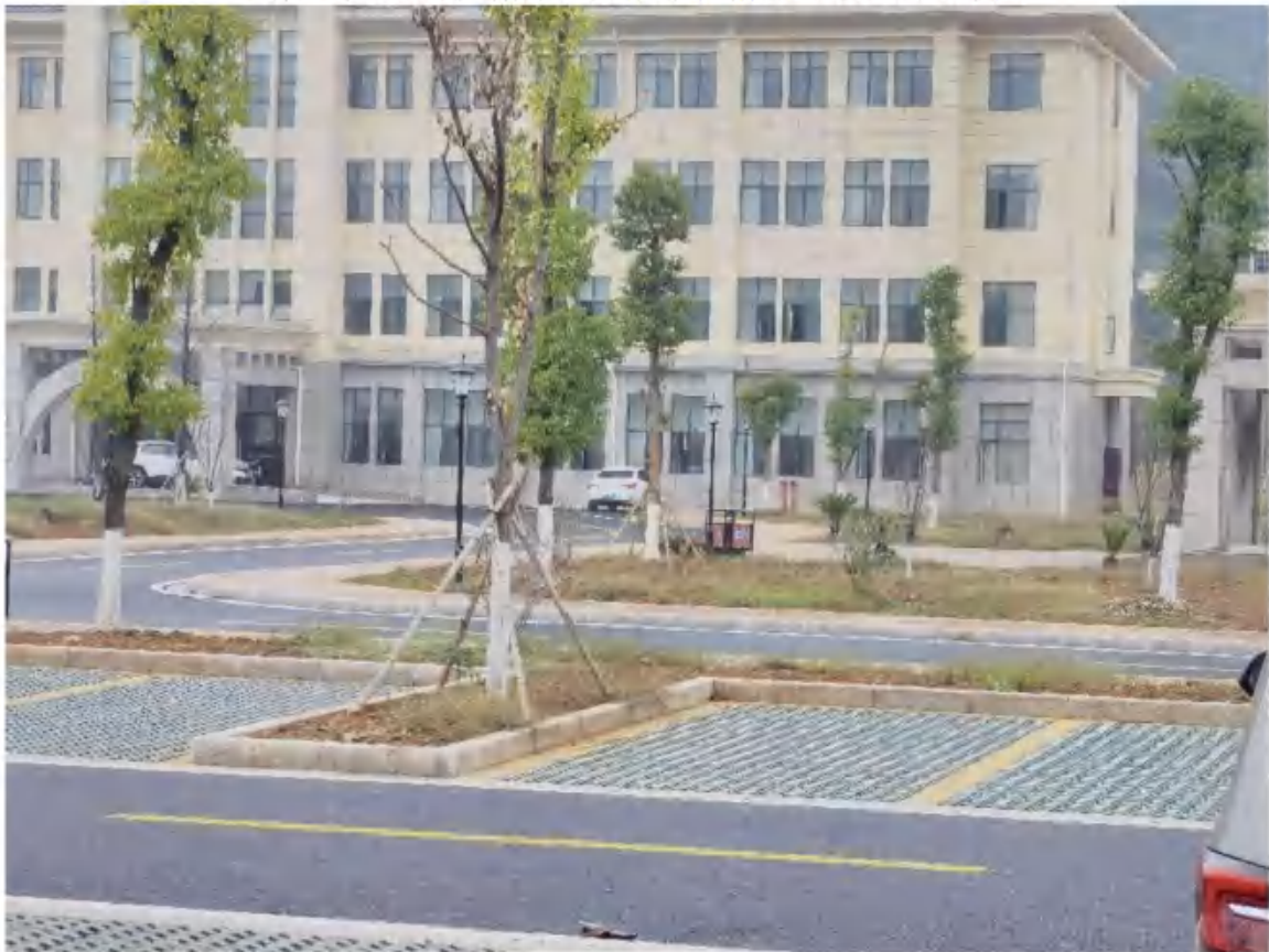
主体工程区透水铺装、园林绿化措施（2022年11月）