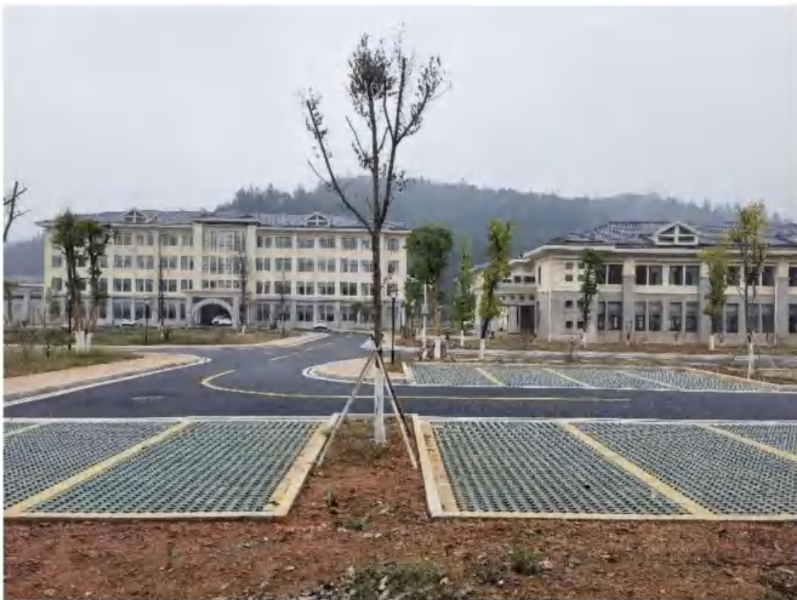
主体工程区园林绿化措施（2022年11月）