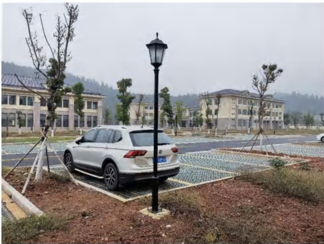
主体工程区透水铺装、园林绿化（2022年11月）